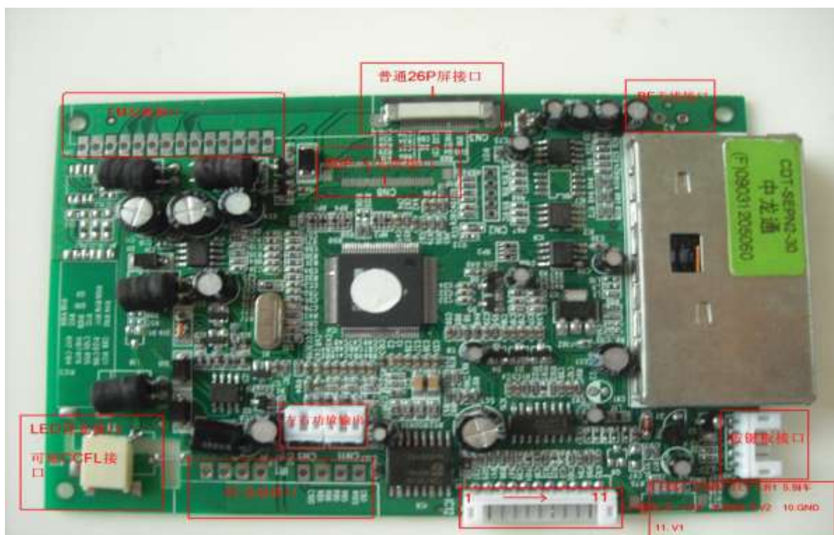
附录 2: 驱动板外观

深圳天宇朗通科技有限公司, 电话, 075528896081 075528435851 手机, 13501573920 邮箱, 13501573920@139.com , Haier-tcl-putian@139.com 公司展销地址, 中国深圳华强北振华路高科德四楼 42073